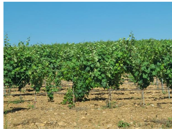
Vignes susceptibles d'être irriguées avec des EUT à Canet-en-Roussillon (juillet 2024)