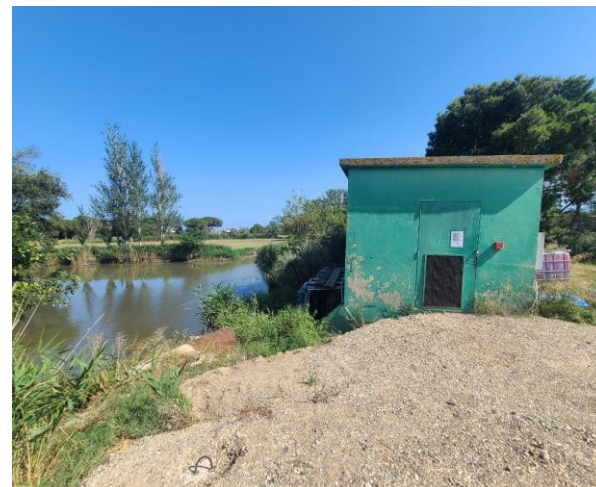
Stockage d'EUT pour le golf de Saint-Cyprien (juillet 2024)